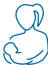
Ēdinot bērnu ar savu krūts pienu