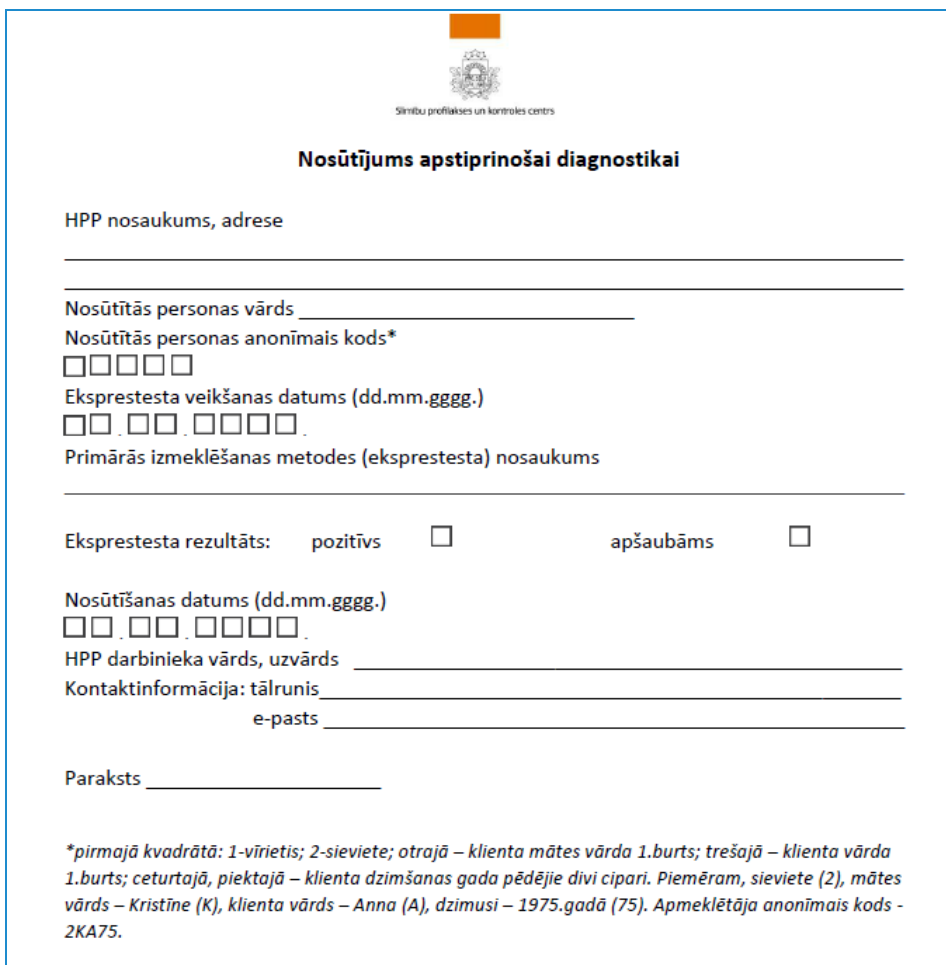
1.attēls. Nosūtījums apstiprinošai diagnostikai