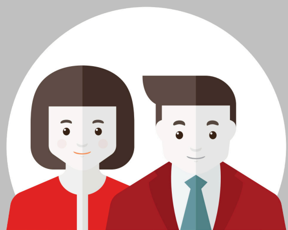
Vīrieši un sievietes