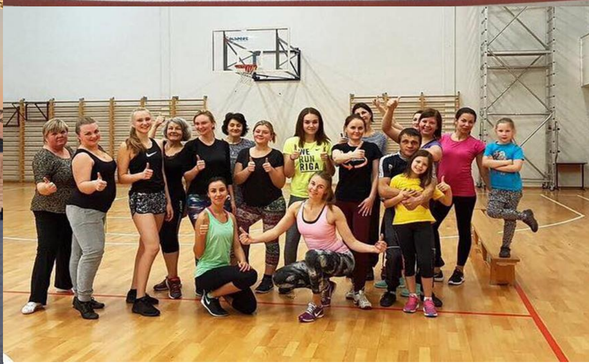
Eiropas Savienības fonda projekts Nr. 9.2.4.2/16/I/021 (PVS ID 3634) "Mēs par veselīgu Rīgu- daudzveidīgi un pieejami veselības veicināšanas un slimību profilakses pasākumi!"