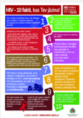
"HIV - 10 fakti, kas Tev jāzina!", A4, 1 lpp (piee- jams tikai elektroniskā formātā)