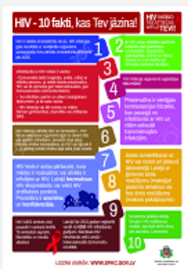
"HIV - 10 fakti, kas Tev jāzina!", A4, 1 lpp (piee- jams tikai elektroniskā formātā)