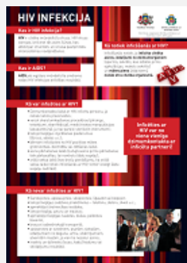
"HIV infekcija", A4, sa- locītā formātā (piee- jams tikai elektroniskā formātā)