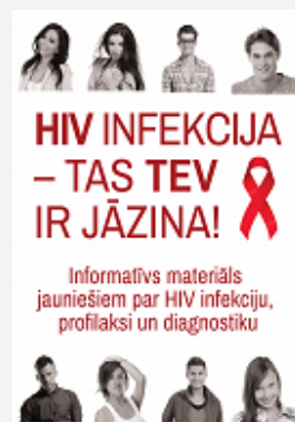
"HIV infekcija - tas tev ir jāzina!", A5, 8 lpp (piee- jams tikai elektroniskā formātā)