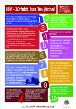
"HIV - 10 fakti, kas Tev jāzina!", A4, 1 lpp (piee- jams tikai elektroniskā formātā)